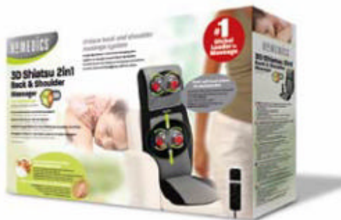
Massage in 3D für Nacken