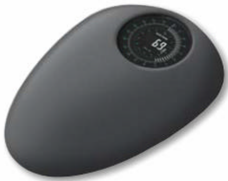
Ein Hingucker: Personenwaage von Salter.

Der Wellbeing-Markt stellt ein enormes Wachstumspotenzial dar. Grund dafür ist, dass immer mehr Menschen ihre eigene Gesundheit als wertvollstes Gut schätzen. Somit ist der Konsument heute mehr denn je bereit, durch gezielte Prävention vorzubeugen. Einen bedeutenden Beitrag zum Wohlbefinden liefern Massagen. Hier setzt HoMedics an. Qualitativ hochwertige Produkte mit einem ausgezeichneten Preis-Leistungs-Verhältnis überzeugen den Kunden und schaffen eine wichtige und attraktive Erlebnisatmosphäre im Handel. Die Handelspartner wiederum profitieren von dem stetig wachsenden Markt der Massageprodukte und haben in HoMedics einen kompetenten Anbieter gefunden.